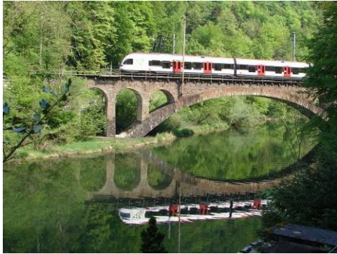
Birs nach Grellingen