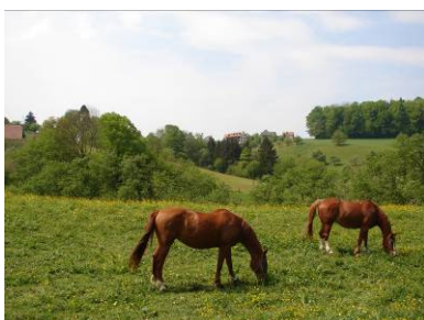
vor und bei Meltingen