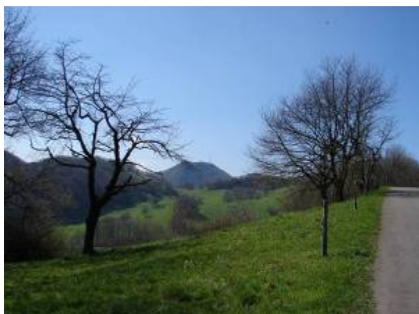
Nach dem Start auf der Staffelegg Blick in Richtung Wasserflue

Restaurant : Salhöchi, Ruhetag: Mo, Tel: 062 844 10 14, www.chalet-saalhoehe.ch (übernachten auf der Barmelweid möglich -> www.hotel-geissflue.ch )