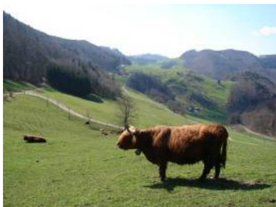
und jetzt noch hinüber zur...