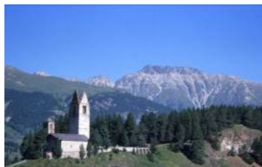
Kirche San Gian von Celerina