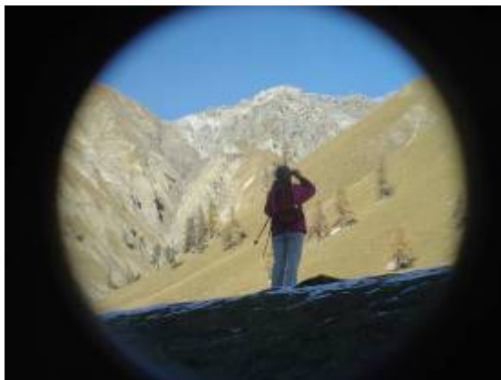
Wo sind die Tiere?