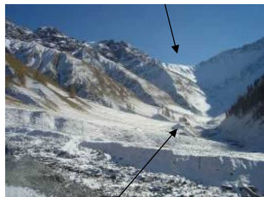
Alp Trupchun (Anfang Nov.)