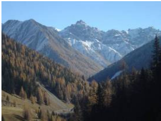
Blick ins Val Trupchun