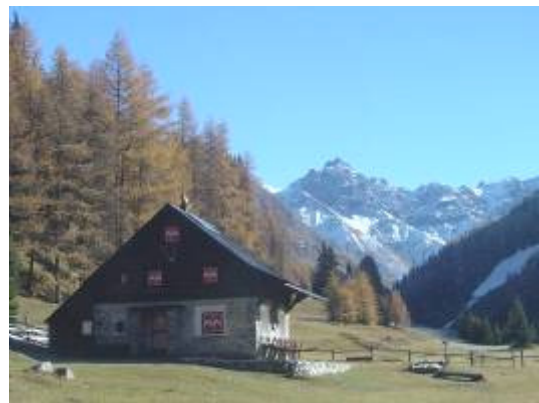
Chamanna dal Parc Varusch